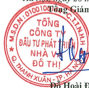
Đỗ Hoài Đông