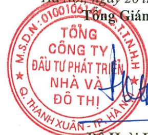
Đỗ Hoài Đông