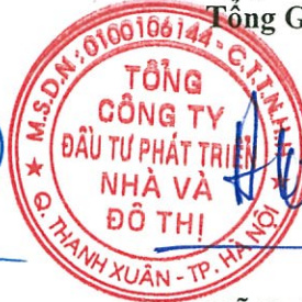
Đỗ Hoài Đông